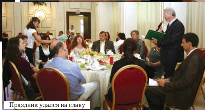
Праздник удался на славу

только ориентироваться в рыночных реалиях, но и получать заказы.